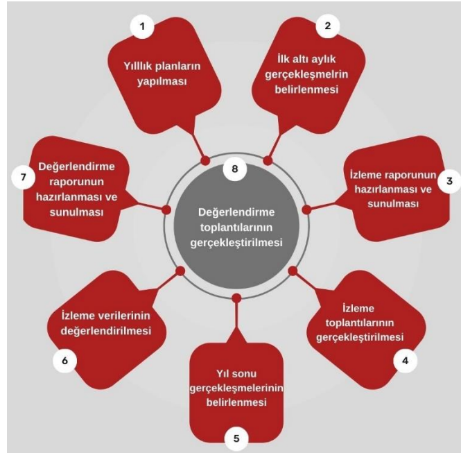
Şekil 1: İzleme ve Değerlendirme Süreci

İzleme ve değerlendirme sürecinin işleyişi ana hatları ile Şekil 1’de özetlenmiştir. Denizli MEM 2024–2028 Stratejik Planı’nda yer alan performans göstergelerinin gerçekleşme durumlarının tespiti yılda iki kez yapılacaktır. Ara izleme olarak nitelendirilebilecek yılın ilk altı aylık dönemini kapsayan birinci izleme kapsamında, MEM Stratejik Plan İzleme ve Değerlendirme Modülü vasıtasıyla, harcama birimlerinden sorumlu oldukları performans göstergeleri ve stratejiler ile ilgili gerçekleşme durumlarına ilişkin veriler toplanarak konsolide edilecektir. Performans hedeflerinin gerçekleşme durumları hakkında hazırlanan “Stratejik Plan İzleme Raporu” Müdür, Müdür yardımcıları, birim amirleri ve kurum içi paydaşların görüşüne sunulacaktır. Bu aşamada amaç, varsa öncelikle yıllık hedefler olmak üzere, hedeflere ulaşılmasının önündeki engelleri ve riskleri belirlemek ve yıllık hedeflere ulaşılmasını sağlamak üzere gerekli görülebilecek tedbirlerin alınmasıdır. Yılın tamamına ilişkin ikinci izleme kapsamında ise MEM Stratejik Plan İzleme ve Değerlendirme Modülü vasıtasıyla, tarafından harcama birimlerinden sorumlu oldukları performans göstergeleri ve stratejiler ile ilgili yıl sonu gerçekleşme durumlarına ait veriler toplanarak konsolide edilecektir.